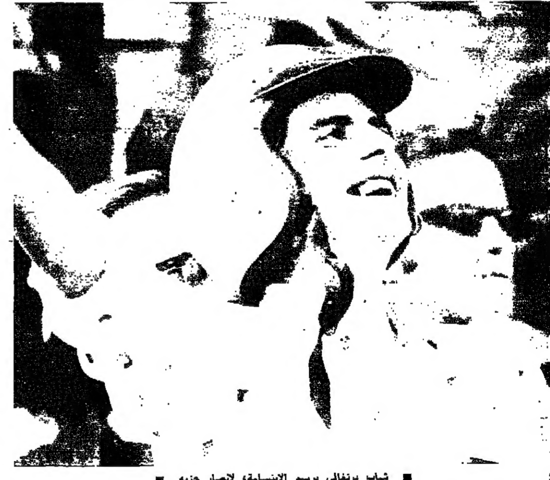
■ شاب برتغالي يرسم الإنسانية، لانصار حزبه